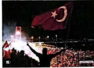
15 TEMMUZ GECESİ

emniyet müdürlüklerinin önünde, kamu binalarının önünde destansı bir mücadele sergilendi. Tankların önüne geçildi, askerlerin kışladan